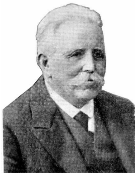
Рис. 9. Володимир Деметрикевич [Kostrzewski, 1949] Fig. 9. Włodzimierz Demetrykiewicz

Однак, як показує статистика, до останньої чверті XIX ст. переважна більшість старожитностей знайдена випадково. Після виставки у Відні на сторінках періодичних видань Галичини час від часу з'являлися коротенькі повідомлення про знахідки селянами різних старовинних ліпних посудин, крем'яних ножів та серпів, речових та нумізматичних скарбів або невідомих архаїчних предметів.