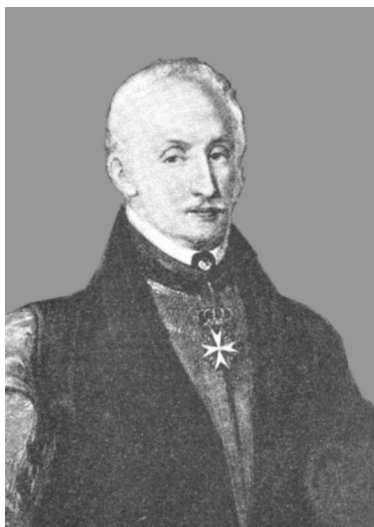
Рис. 1. Генрі Любомирський [Katalog muzeum imienia Lubomirskich., 1877]

Першу спробу підсумувати результати вивчення старожитностей, досягнутих за століття, здійснив Богдан Януш (Василь Карпович). У його працях велику увагу приділено діяльності перших фахових археологів та виникненню наукових товариств у Галичині [Janusz,