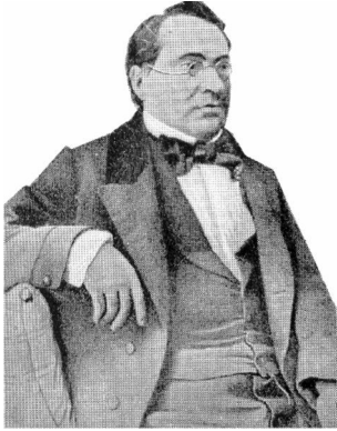
Рис. 10. Адам Кіркор [Kostrzewski J., 1949] Fig. 10. Adam Kirkor

З метою впорядкування наукових археологічних досліджень та підняття їх до нового якісного рівня наприкінці XIX ст. Археологічна комісія при Краківській Академії Наук прийняла рішення про видання спеціальних дозволів на проведення археологічних робіт. Дозвіл видавали лише особам, які займалися науково-дослідною діяльністю, а також представляли наукову чи культурно-освітню установу. Це були перші „відкриті листи” на право проведення археологічних розкопок в Галичині. Однак, такий захід не завжди мав підтримку серед місцевих адміністративних органів.