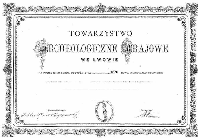
Рис.8. Членський квиток Крайового Археологічного товариства (фонди ЦДІА у Львові) Fig 8. Certificate of the member of Regional Archeological Society

Старожитностями Галичини цікавилась і метрополія. Особливим розпорядженням австрійського намісника у Львові (що, до речі, виходило із прохання канцелярії австрійського цісара з Відня), було наказано діячам Ставропігії (на той