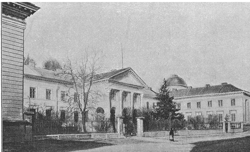
Рис 4. Львів. Будинок Осолінеуму (початок XIX ст.) [Przewodnik wystawy starożytniczej Lwowskiej w r. 1861]

Відомості про Збруцького ідола поширилися далеко за межі Галичини. На численні замовлення його представляли для огляду в багатьох населених пунктах нашого краю (у Кам'янці-Струмиловій, Тереховлі, Добротворі, Белзі, Бродах, Янові), а також за кордоном.