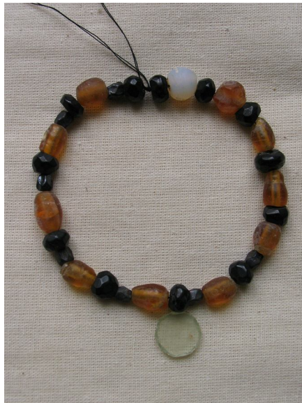
Фото 11. Дубно. Бернардинський костел. Притвор. Розкоп 1. Поховання 8. Складене намисто із розрізаних вервиць* Photo 11. Dubno Bernardynian church. Atrium. Excavation area 1. Burial 8. Glass necklace from separate beads