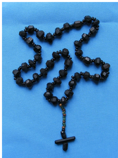
Фото 12. Дубно. Бернардинський костел. Притвор. Розкоп 1. Поховання 13. Складена вервиця* Photo 12. Dubno Bernardynian church. Atrium. Excavation area 1. Burial 13. Glass bead