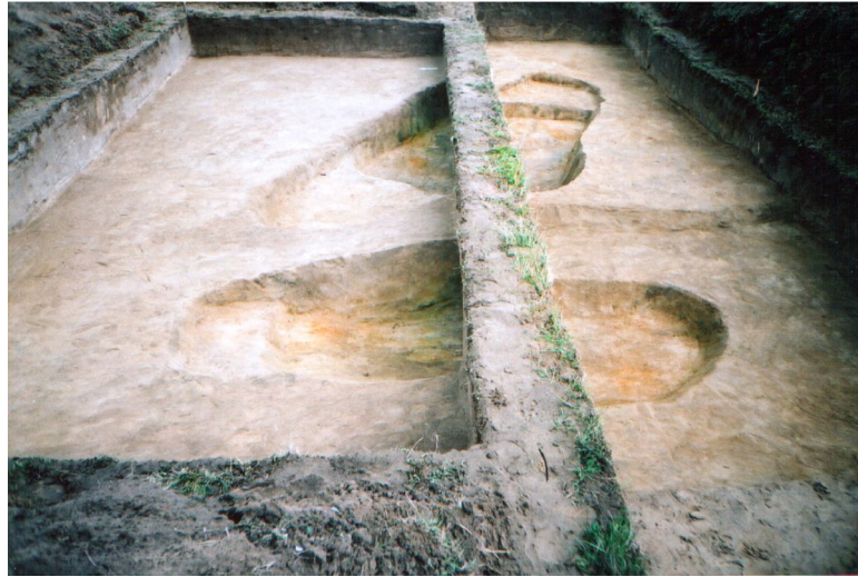
Фото 1. Калинівка II. Дослідження 2003 р.* Photo 1. Calynivka II. Research in 2003