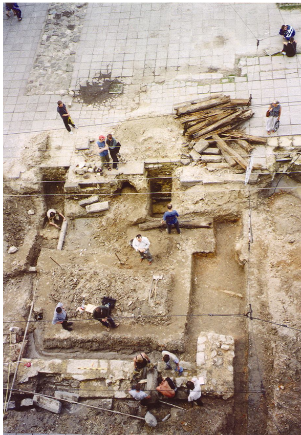
Фото 6. Рятівні розкопки на вулиці Руській. 2002 р. Загальний вигляд зверху, з півдня** Photo 6. Excavations on Rus'ka St. In 2002. General view from south