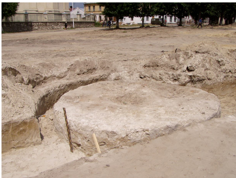
Фото 7. Кам'яна основа для стовпа ганьби на пл. Вічевій у Жовкві* Photo 7. Stone base of the disgrace-post on Vicheva square in Zhovkva