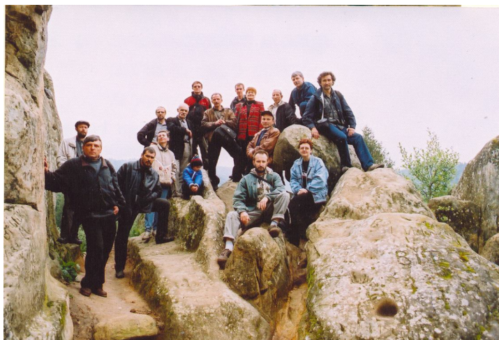
Фото 13. Учасники Міжнародної конференції “Археологія заходу України: підсумки останнього десятиліття” під час екскурсії на середньовічну фортецю Тустань (Урицькі скелі). 28 травня 2004 р.* Photo 13. Participants of International conference “Archaeology of Western Ukraine: summary of the last decade” during the excursion on medieval fortress Tustan’ (Uryts’ki cliffs). 2004, May 28