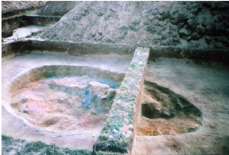
Фото 3. Калинівка II. Дослідження 2003 р.* Photo 3. Calynivka II. Research in 2003