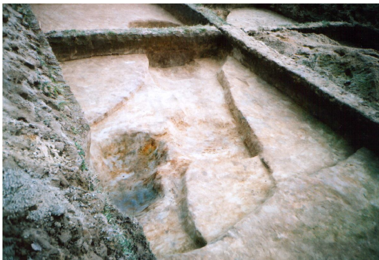
Фото 4. Калинівка II. Дослідження 2003 р.* Photo 4. Calynivka II. Research in 2003