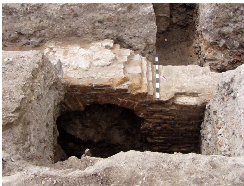
Фото 8. Процес розкриття підвальної стінки давньої ратуші у Жовкві* Photo 8. Process of the excavation of cellar wall of ancient town-hall in Zhovkva