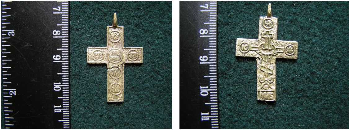
Фото 5. Натільний хрестик з Унева* Photo 5. Little cross from Univ