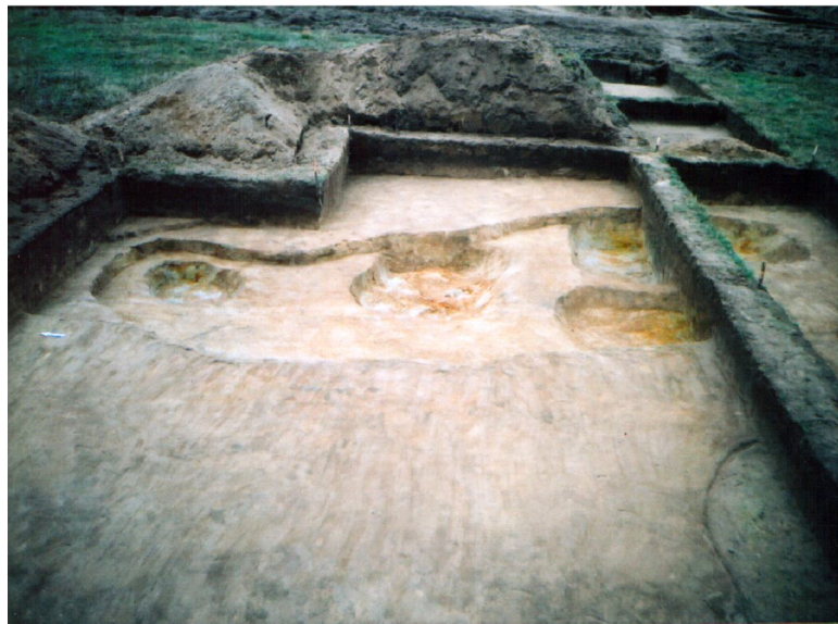
Фото 2. Калинівка II. Дослідження 2003 р.* Photo 2. Calynivka II. Research in 2003