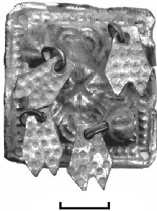
Рис. 1. Деталь давньоруського чільця з Недобоївського городища (розкопки С. Пивоварова) Fig. 1. Fragment of a woman's head covering from Nedobojiv's'ke hill-fort (excavated by S. Pyvovarov)

Релігійний синкретизм, що набував поширення після введення християнства на Русі, чи не найбільше проявлявся у виробках прикладного мистецтва, зокрема у ювелірних, основна маса яких була приналежністю жіночого костюму. Прикраси голови, шії, рук, крім естетичного, мали і глибокий символічний зміст, спрямований на захист відкритих частин тіла людини, створюючи своїм семантичним навантаженням, в якому перепліталися язичницькі та християнські елементи, своєрідний мікрокосм народного костюма. У цій системі відповідності макрокосму мікрокосму традиційного костюма головний убір виражав ідею неба [Рыбаков, 1988, с. 519]. Разом з назвами (“кокошник”, “кіка”, “сорока”) самого убору голови всі його прикраси були пов’язані з сонцем, небом, птахами. Солярний культ отримав у дохристиянській Русі найбільше поширення і у своєму розвитку дійшов до стадії персоніфікованих сонячних божеств. В Україні і дотепер зберігся відгомін вірувань у божественну природу Сонця і сонячного світла, що виступає своєрідним антиподом силам тьми і зла, розсіює і знешкоджує всі ворожі людині сили [Скрипник, 2000, с. 437].