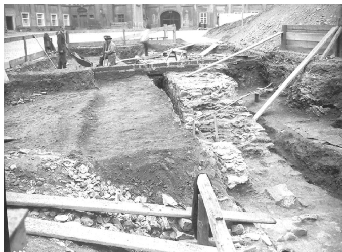
Рис. 4. Празький град. Археологічні розкопки Fig. 4. Prague hill-fort. Archaeological excavations

Від початку 1925 р. Я. Пастернак, не без участі Л. Нідерле, включений до складу державної експедиції Чеського інституту археології. Йому доручено безпосереднє ведення масштабних археологічних розкопок замку на Градчанах, що чеською владою розглядался як майбутня резиденція президента ЧСР. На спеціальне замовлення президента ЧСР Т. Масарика словенський архітектор Йоже Плечник (Jože Plečnik, 1872-1957) створив генеральний проект реконструкції Празького граду. Створена Археологічна комісія, до якої входили А. Стоцький, К. Гут, В. Бірнбаум, К. Бухтела, виготовила загальний план досліджень на кілька років. Для