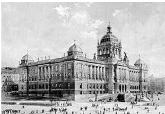
Рис. 3. Народний музей у Празі (XIX ст.) Fig. 3. Public museum in Prague (XIX century)