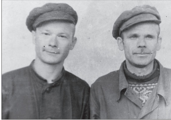
Юрій Шухевич і Євген Горошко. Мордовія, 1962 р.

лежна Україна і які люди потрібні, щоб вона залишалась Україною.