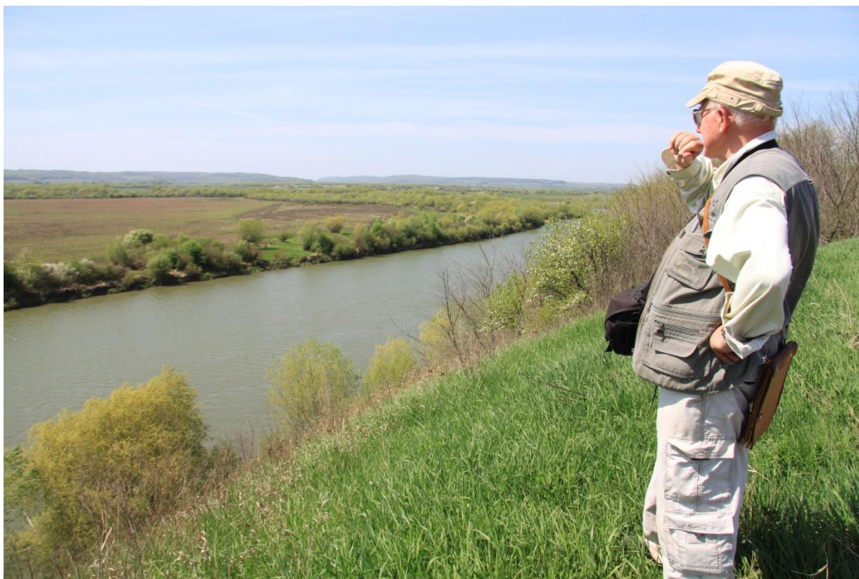
Рис. 1. Над Дністром – рікою свого дитинства. Розвідки поблизу сіл Тенетники і Мартинів у 2012 р. Fig. 1. Over Dnister – the river of his childhood. Surveys near Tenetnyky and Martyniv villages in 2012

Після проголошення незалежності України, професор, чи не перший серед польських археологів, ініціював проведення спільних українсько-польських археологічних досліджень у верхній Наддністрянщині і від 1992 р. став співкерівником археологічної експедиції, у якій упродовж 22 років активно працювали співробітники відділу археології Інституту українознавства ім. І. Крип'якевича НАН України. Співпраця реалізовувалася у межах виконання угод, підписаних спочатку між Інститутом археології і етнології ПАН та Інститутом українознавства ім. І. Крип'якевича НАН України, а пізніше з Жешівським університетом. До співпраці була залучена ще одна вагома установа – Польська академія науки і мистецтв ( PAU ).