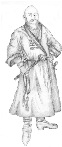
Ryc. 3. Szlachcic ma na sobie polski stroj narodowy, przewiązany pasem siatkowym, zakończony ozdobnymi chwostami (rys. Maja Drązkowska wg M. Gutkowska-Rychlewska)

Рис. 3. Шляхтич у національному вбранні, підперезаний ажурним поясом з китичками (рис. Майї Дронжковської згідно М. Гутковської-Рихлевської)